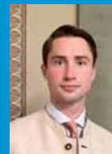
Hans Niessl Landeshauptmann von Burgenland

Ich wünsche den Seglern und Veranstaltern eine erfolgreiche Meisterschaft und eine schöne Zeit im Burgenland. Den Organisatoren vom Yachtclub Breitenbrunn danke ich für die Organisation und hoffe, dass die Windverhältnisse einen spannenden Ablauf der Wettfahrten ermöglichen werden.